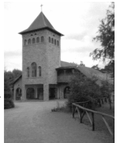
La Chapelle du Message à Banneux nous accueillera le vendredi 26 septembre 2003.