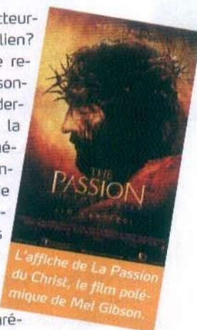
L'affiche de La Passion du Christ , le film polémique de Mel Gibson.