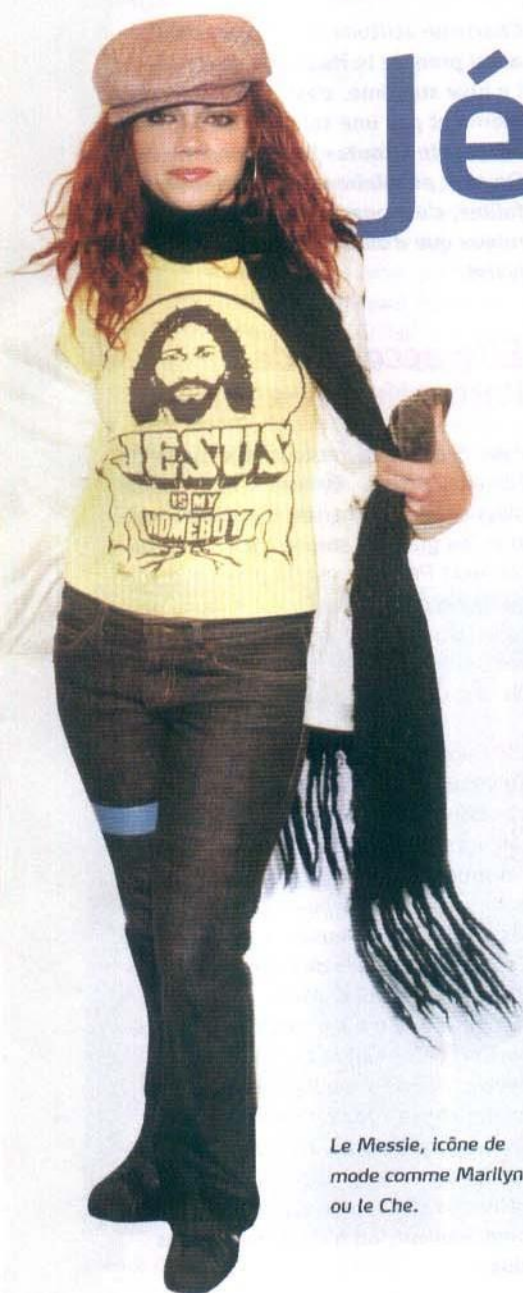
Le Messie, icône de mode comme Marilyn ou le Che.

A Ibiza, la marque de jeans Jesus fait fureur.