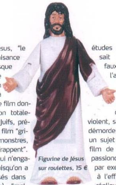
Figurine de Jésus sur roulettes, 15 €

de flagellation de Jésus, "le summum de la complaisance dans la violence, puisque les seize minutes de film transforment un être humain en chair à boucherie". Selon lui, le film donnerait aussi une vision totalement caricaturale des Juifs, présentés tout au long du film "grimaçant comme des monstres, qui crient, griffent et frappent". Bref, à l'en croire (ce qui n'engage bien sûr que lui, puisqu'on a trouvé des avis opposés dans des médias différents), "mal joué, manichéen et dichotomique, le film ne peut que provoquer une haine abyssale pour l'autre".