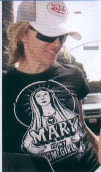
Madonna, un nom prédisposé