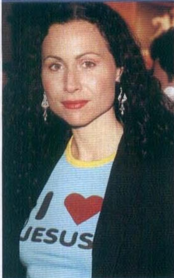
Minnie Driver, angélique...